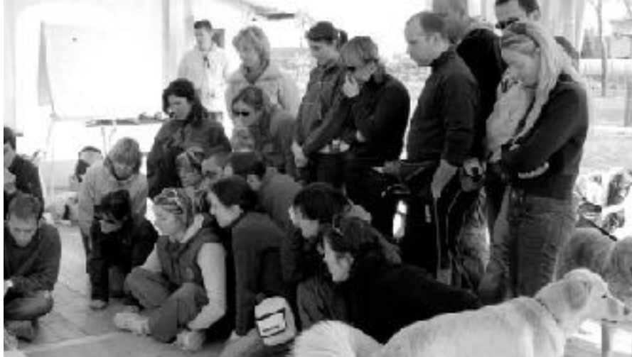
Tutti al lavoro: un bellissimo scatto che rappresenta l'atmosfera pratica, cooperativa e attenta che si sprigiona durante i corsi ThinkDog.

Contenuti di altissima qualità permettono a questa Scuola di dettare i tempi in termini di formazione.